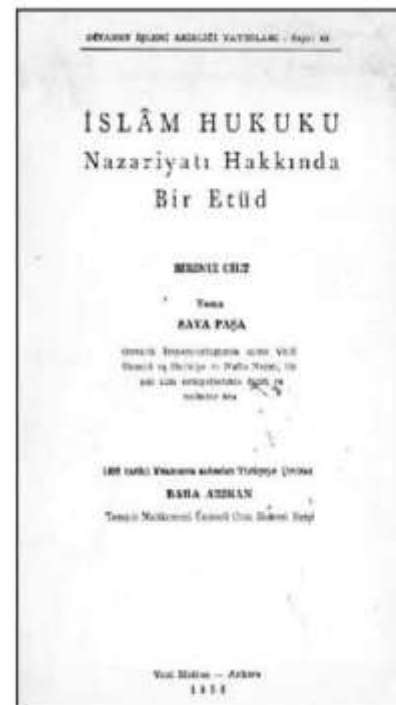
Sava Paşa, İslâm Hukuku Nazariyatı Hakkında Bir Etüd , (Çev. Baha Arkan), Ankara, Diyanet İşleri Başkanlığı, 1955, 2 Cilt.