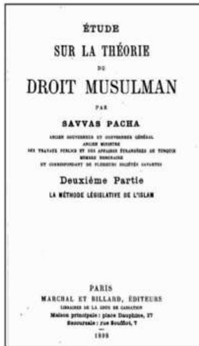
Savvas Pacha, Étude sur la théorie du droit musulman , Paris, Marchal et Billard, 1892 ve 1898, 2 Cilt.

Ωστόσο, ο Ιωάννης Σάββα Πασάς παραμέρισε αυτόν τον "ισχυρισμό" ότι το ρωμαϊκό δίκαιο είχε επιρροή στο ισλαμικό δίκαιο στην αρχή, και δήλωσε ότι η σαφής και οριστική ανάπτυξη του ισλαμικού νόμου αργότερα ήταν έργο των Ουλεμάδων που ασχολούνταν με τη νομική εκπαίδευση και τις δικαστικές δραστηριότητες. Ο ίδιος δήλωσε ότι εάν δεν είναι γνωστές οι πηγές των κανόνων που αυτοί οι αξιότιμοι λόγιοι και μουτζαχεντίν κήρυτταν και θέσπισε λύνοντάς τους ως θέμα και δεν είναι γνωστές οι μέθοδοι που χρησιμοποιήθηκαν για την εξαγωγή αυτών των διατάξεων, μπορεί να υποστηριχθεί ότι ελήφθη η ισλαμική νομοθεσία από το ρωμαϊκό δίκαιο που ισχύει στη Συρία.