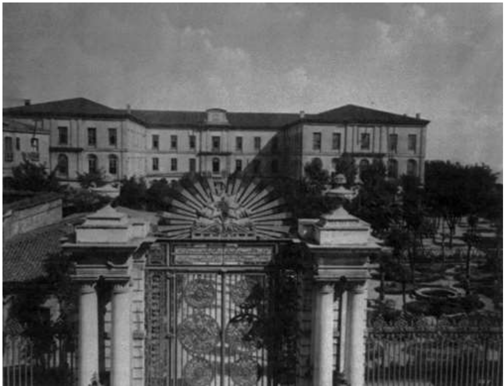
Η Αυτοκρατορική Σχολή στο Πέρα

Ο Ι. Σάββα Πασάς στο έργο του τονίζει: «Η απόκτηση σαφών πληροφοριών για τα πρώτα εξελικτικά στάδια του ισλαμικού νόμου και η διενέργεια απαραίτητων ερευνών σχετικά με τις πηγές αυτού του νόμου και τον τρόπο με τον οποίο προέκυψε, θα οδηγήσει τους δυτικούς μελετητές να δουν τη συσχέτιση μεταξύ των δύο νόμων από διαφορετικό επίπεδο, και έτσι να έχουν μια ι-